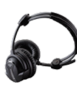
SENNHEISER HD 26 PRO